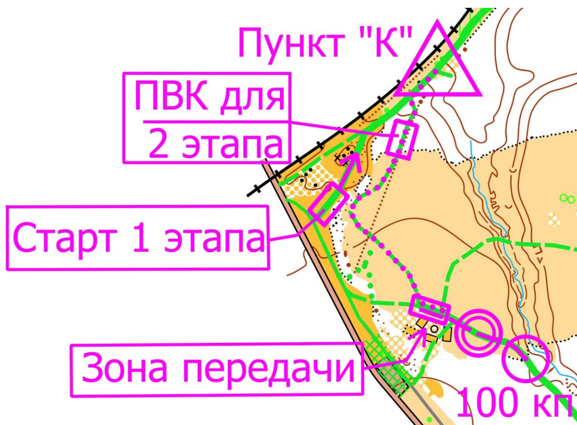
Схема центра соревнований:

Центр соревнований, координаты - 55.737442, 37.298524